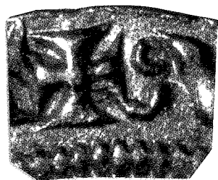
Macro du revers : signe initial