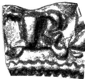
Macro du revers : R de Imperat

sur les écus à la chaise. On relève également une autre particularité non systématique sur ce monnayage : chaque mot de la légende XPC comporte un signe abrégé après le P.