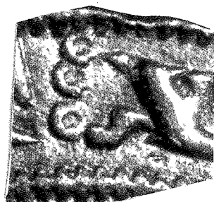
Macro du revers : ponctuation